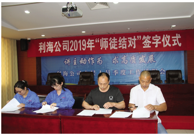
为了进一步加强职工队伍建设,完善人才培养机制,促进员工实现职业生涯发展目标。8月22日,利海公司举办了“师徒结对”签字仪式。装置操作、维护维修、仪表电器、计算机处理、安全环保等共14对师徒现场签订了协议。(梁娟)