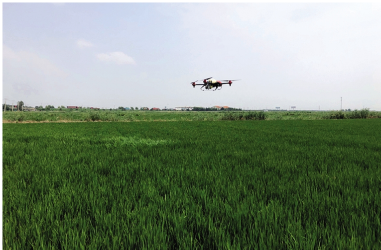
当前水稻已陆续进入破口期,是病虫防治的关键时期。青口投资公司、灌西明威公司紧抓防治工作不放松,重点观测防控孕穗、破口期病害发生,采取气球打药和飞机打药相结合的方式对水稻进行病虫防治,防治效率和防治效果均好于往年。图为利用小飞机进行水稻植保。