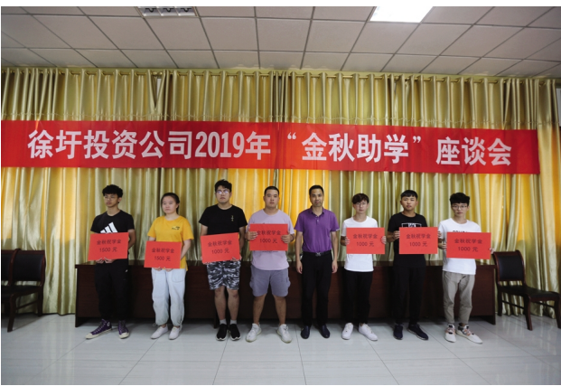
连日来,集团公司工会以及各单位纷纷开展“金秋助学”走访慰问活动,为莘莘学子送去助学金和学习用品,勉励他们要志存高远,自强不息,早日成才,努力在报效祖国、回报社会的伟大事业中奉献青春智慧,实现人生价值。(徐宣西宣)

全面健身促提升。组织女职工户外踏青、读书座谈等四项活动;举办五一青年歌咏比赛,开办女职工瑜伽室,丰富女职工的文化生活,进一步提高职工的幸福指数和身体素质。(电工)