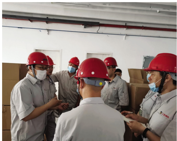
5月13日上午,神特公司领导班子坚持一线工作法,到二期车间成品卷绕区现场办公,针对现有生产难题,充分研讨,集思广益,研究解决生产难题,形成可行性工作方案,群策群力谋求企业高质量发展。(神特宣)

2019徐圩国际马拉松赛、“蓝天保卫战”、完成各项“重大活动保障”和“临时突击性保障”工作达36次,投入大型清扫、洒水等保障机械16辆,230台班,人员达4500余人次,清理海岸线13公里,白色垃圾10000余袋。其快捷反应、高效服务、保障成效受到业界高度赞誉。未来五年,悦升将以稳步拓展市政管养业务,精心打造“市政规模化”,建立“品牌悦升、品质悦升”,以质优高效的服务赢得市场信誉,成为市政设施养护的生力军,新区“大环卫体系建设的主导者”而勠力前行。(悦宣)