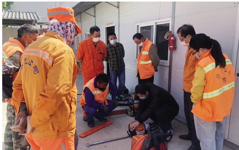
今年以来，华茂裕祥养护公司将提升绿化员工专业技能作为培养高素质绿化养护队伍的重要抓手，加强与绿化机械设备生产厂家的联系合作，多次邀请厂家专业技术人员到公司进行绿化机械设备操作、养护等知识培训，参训人员达180多人次。图为油锯操作现场培训。