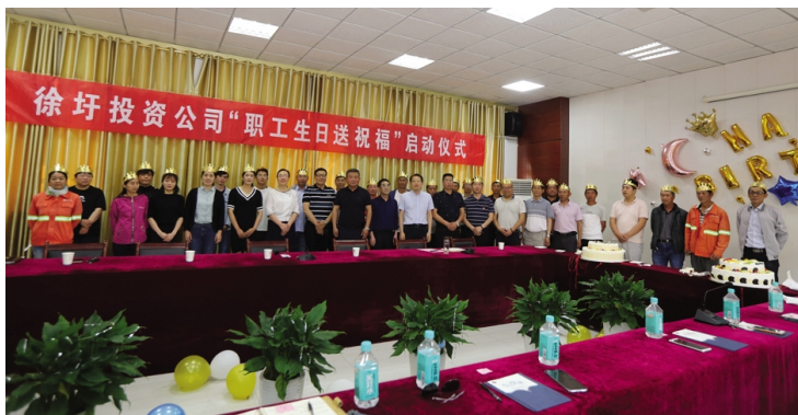
5月27日下午，徐圩投资公司举行“职工生日送祝福”启动仪式，为5月过生日的35位职工举办集体生日“三个一”送祝福活动。从即日起，徐投资公司工会每月为节点，为在岗职工生日时送去一份祝福、一封生日贺卡、一张蛋糕卡。