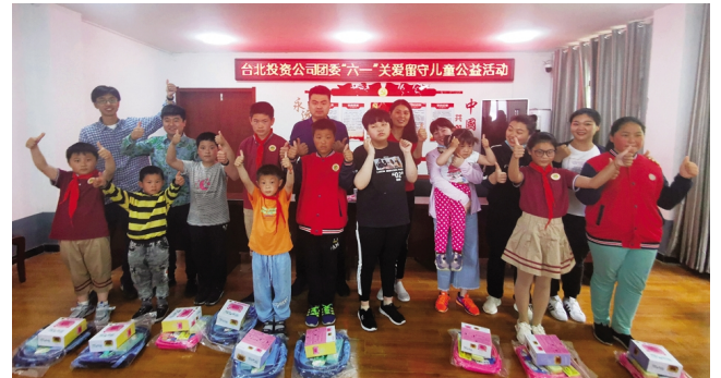
5月29日,台北投资公司青年代表一行来到赣榆区团洪村,开展“关爱留守儿童·传递点滴爱心”公益活动,向他们送去工投人的关爱和祝福。(韩挺)