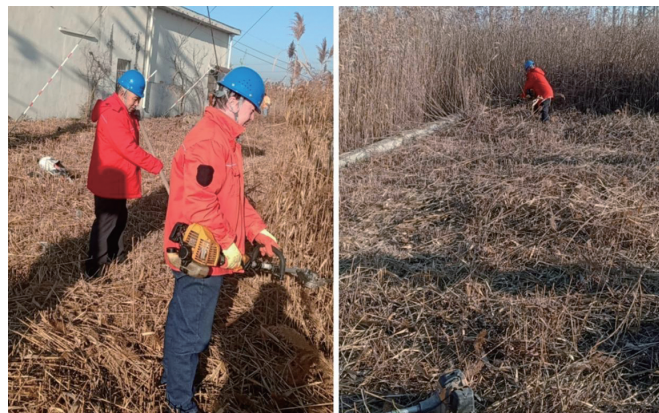
1月4日，供电公司徐南供电所成立除草先锋小组，积极开展“清除杂草藤蔓，消除安全隐患”风险集中整治活动，确保电网安全稳定运行。（邱利益）