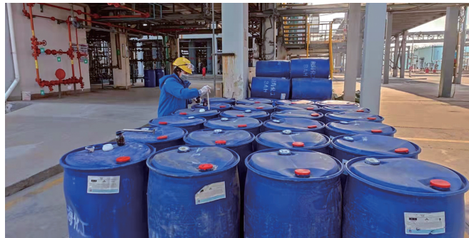
为保证节日期间产品的正常供应,元旦期间,利海化工公司 120 名职工放弃与家人团聚的机会,立足本职,坚守岗位。节日期间加班 230 次,完成工时 2320 小时,生产化工产品 529.25 吨。图为检测中心员工进行苯甲醛产品的取样化验。