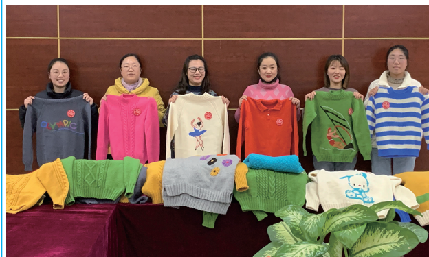
日前，徐圩投资公司女工委持续开展市妇联“恒爱行动——百万家庭亲情一线牵”公益活动，申领 100 斤爱心毛线，组织广大女职工、职工家属编织 50 余件爱心毛衣，再一次用实际行动持续接力“爱心公益”行动，为贫困儿童送去温暖、传递爱心。（茹莹）

坚持学用结合，在“融”字上下功夫。从做好全年重点工作着手，在原原本本传达学习全会精神的同时，与学习贯彻习近平新时代中国特色社会主义思想、开展党史学习教育相结合，与做好疫情防控、完成全年目标任务、科学谋划明年工作相结合，公司领导深入基层调研 10 余次，立足工作实际，深入思考研究贯彻落实的思路和举措。以书记抓党建工作等“四项考核”为契机，切实把全会精神贯彻落实到凝聚共识、推动发展的全过程、各方面，用高质量发展的实际成果检验学习贯彻全会精神的实际成效。（仲伟彬）